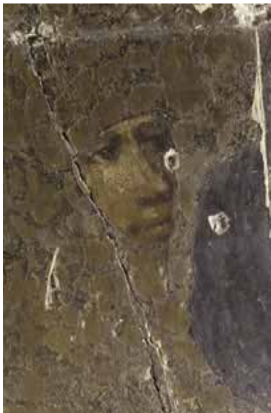
Bertrand de Beauvau tenant l'épée de Louis II d'Anjou, détail du buste.

Cette vaste composition commémore le cérémonial funèbre de Louis II dans une disposition qui sera reprise plus tard par le roi René dans la partie supérieure de son tombeau avec trois chevaliers portant l'un le heaume, l'autre la bannière et le troisième l'étendard. Yolande d'Aragon qui faisait en 1429 des projets pour la sépulture de son époux fut probablement l'instigatrice de ce décor.